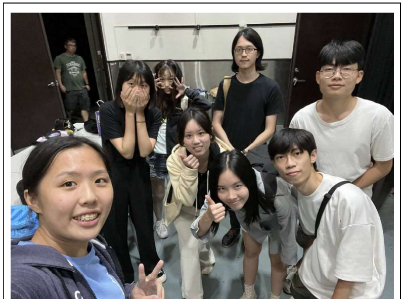
團隊與劇聚成員之合影

作為本年度計畫指標，我們社群預計與中央大學藝文中心、中央大學學生劇團「劇聚」合作，使我們能有在中央大學演出的機會。創造兩效交流的同時也製造聲浪，期待此聲浪做為我們企畫的第一個里程碑，提高能見度並幫助我們在日後更好的做劇場能量的串聯。