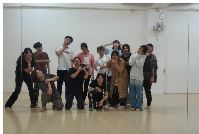
成員與表演導演課老師 —子萱老師合影