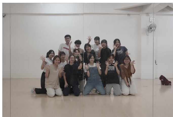
成員與表演導演課老師 —子萱老師合影