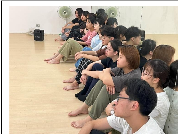
表演導演課課堂實錄