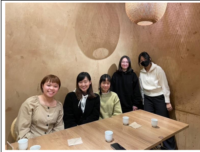
期初餐聚 與修平老師合影