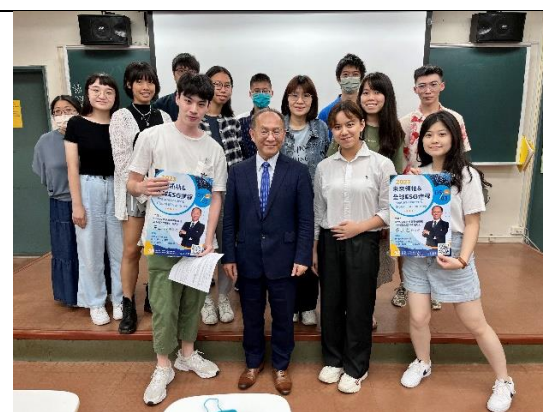
ESG 講座參與者與黃正忠博士的正式版大合照