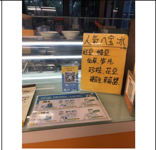
歸還方式介紹(背景為交大研三餐廳的細鳳果茶)