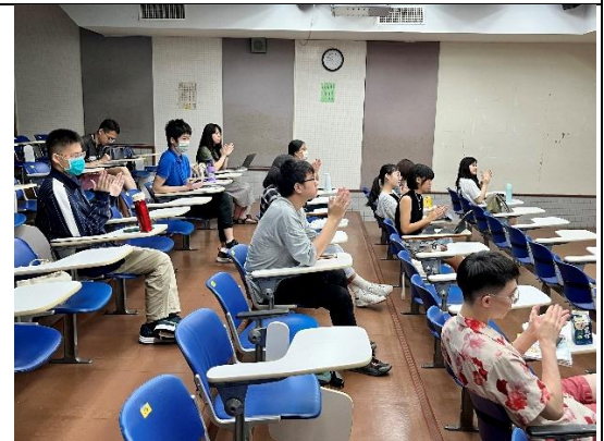
台下實體參加者專注聆聽 ESG 講題