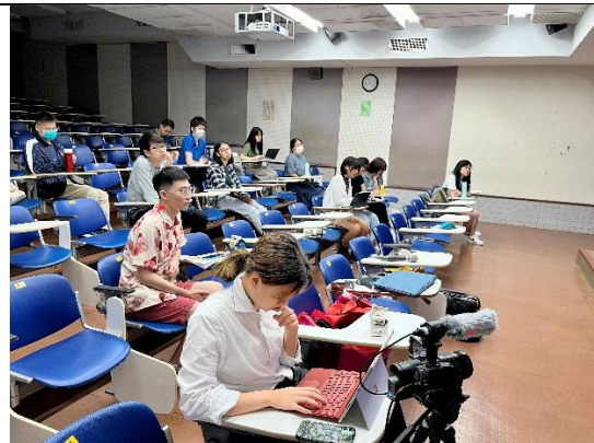
台下實體參加者認真筆記與聆聽